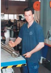
Notre équipe de service chez IKA®

Notre équipe de gestion de service comprends des ingénieurs en électronique, des chimistes, des techniciens de procédés et des mécaniciens