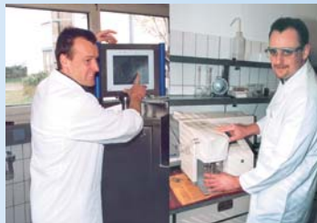
unser Team im Technikum