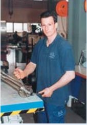
unser Service-Team bei IKA®

Unser Service-Management umfaßt ein erfahrenes Team von Ingenieuren, Elektronikern, Chemikern, Verfahrenstechnikern und Monteuren.