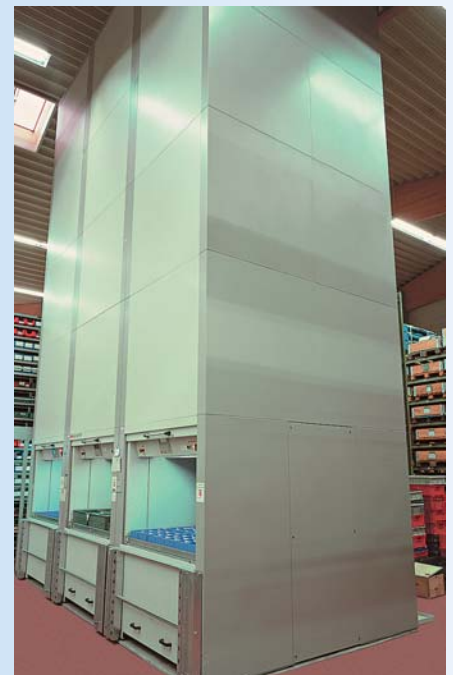
Hochregal zur übersichtlichen Lagerung von Tausenden von Teilen.