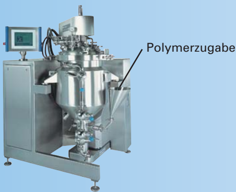
Batch-Prozeß mit IKA® Master Plant